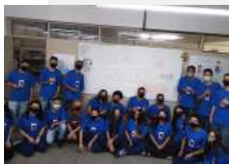
Comunicação Oral e Escrita com a Educadora Social.