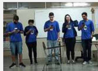
Desenvolvimento de Lideranças com a Educadora Social.