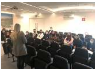
Círculo Saúde - 8 jovens cotizadas