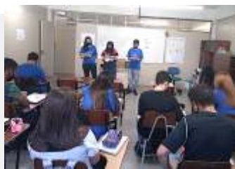
Família com a Educadora Social.