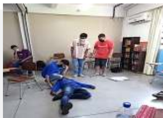
Saúde com a Educadora Social.