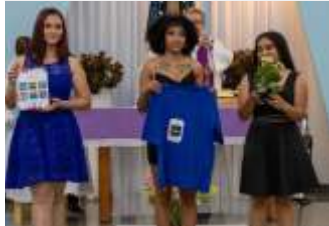
Objetos Ofertados na Missa.