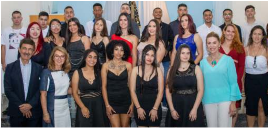
Formandos 2022, Dirigentes, Parainfa e Educadora Social