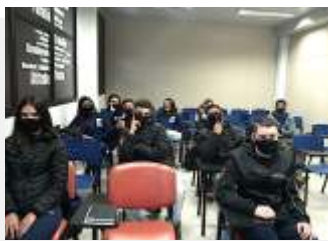
Supermercados Andrezza - 10 jovens cotizados