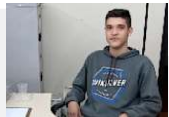
Maqenge - 1 jovem cotizado