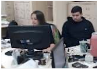
Imobiliária Bassanesi - 1 jovem cotizado