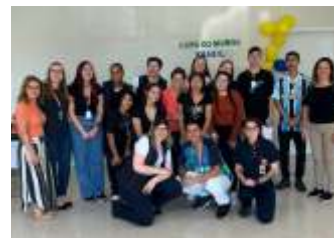
Evento de encerramento do ano no Círculo Saúde com jovens aprendizes e padrinhos