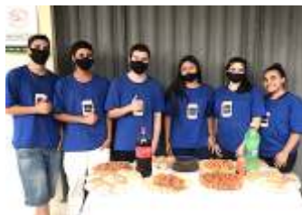
Comemoração de Aniversários