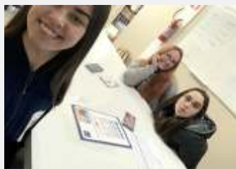
Atendimento ao Cliente com a Educadora Social.