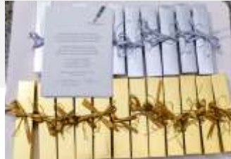
Presentes da Parainfa para os Jovens.