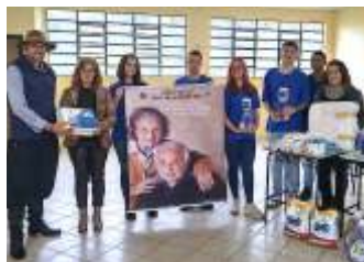
Brechó Beneficente para o Lar de Idosos São Francisco de Assis