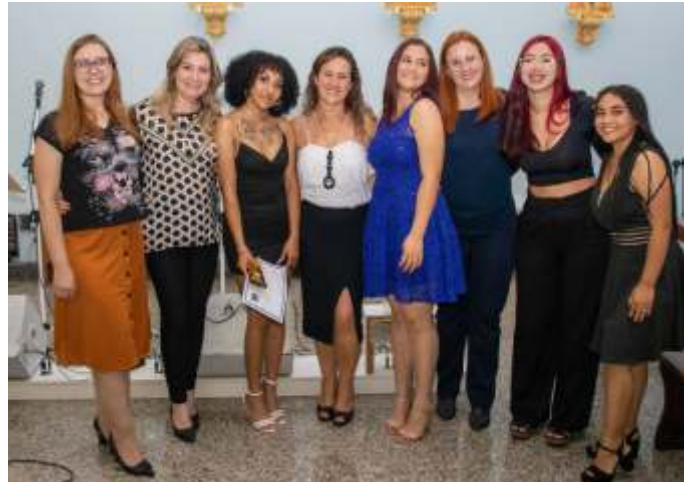
Cotizadora Círculo Saúde, Jovens e Educadora Social.