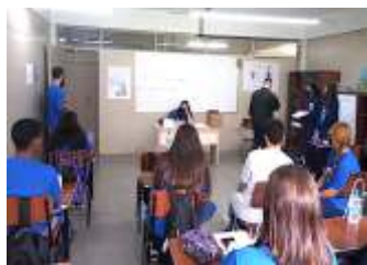
Autoconhecimento com aulas online e presenciais.