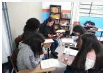
Noções de Marketing com Educadora Social.