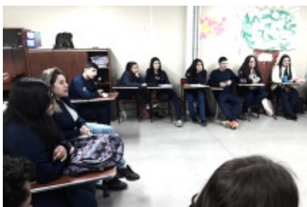
29/07 AVALIAÇÃO DO DIA "QUEM CUIDA DE MIM".