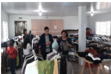
13/07 BEMZAR O BRECHÔ DO PROJETO PESCAR CONSOLAÇÃO TURMAS MANHÃ E TARDE.