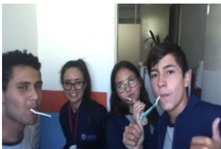
29/03 SAÚDE E QUALIDADE DE VIDA Dentistas voluntárias mostraram aos nossos jovens como manter a saúde bucal.