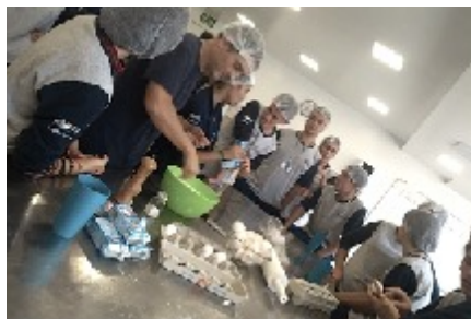
21/03 VISITA TÉCNICA NA UNIFTEC Realização de Oficina de Gastronomia.