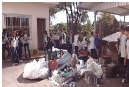
10/04 ROTEIRO CAMINHOS DO LIXO CODECA. O objetivo foi conscientizar e orientar sobre a correta separação dos resíduos orgânicos e seletivos.