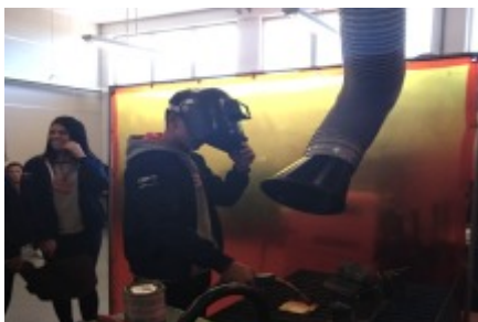
16/05 VISITA TÉCNICA À UNIVERSIDADE DE CAXIAS DO SUL. Oficinas na área de engenharia de materiais.