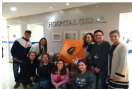
06/08 DESAFIO JOVEM EMPREENDEDOR DA MICROEMPA. Equipe Pescarnáticos.