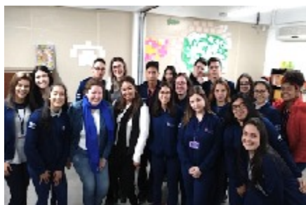
12/08 AS PSICÓLOGAS E OS JOVENS da turma da manhã registrando o encerramento do processo de orientação vocacional.