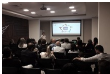
19/11 ENCONTRO DE VOLUNTÁRIOS DO PROJETO CONSOLAÇÃO.