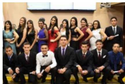
FORMANDOS TURMA DA TARDE 2019 CURSO DE INICIAÇÃO EM SERVIÇOS DE COMÉRCIO