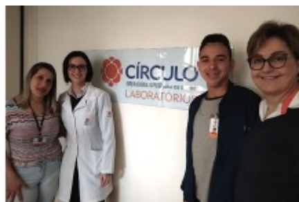
16/09 VISITA TÉCNICA A EMPRESA COTIZADORA CÍRCULO OPERÁRIO CAXIENSE.