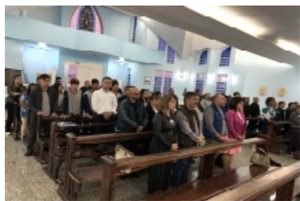
27/11 MISSA DE FORMATURA com jovens, paraninfos, equipe Pescar Consolação e familiares.