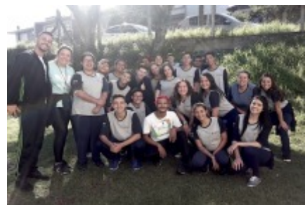
02/05 VISITA DA EQUIPE DA SECRETARIA MUNICIPAL DA CULTURA. Realização de uma oficina de dança com os jovens.