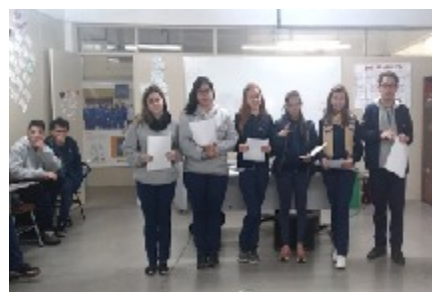
21/10 AS DUAS TURMAS ELABORARAM E APRESENTARAM os textos que participaram da mostra literária da rede recreia.