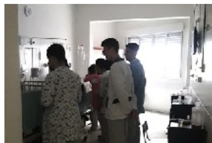
17/09 AÇÃO CONJUNTA COM O PROJETO PESCAR SÃO JOSÉ. Jovens arrecadaram material de higiene para doação no Hospital Geral.