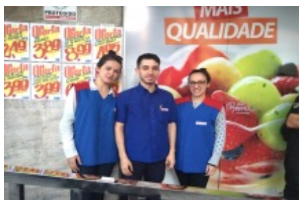
25/09 VISITA TÉCNICA À EMPRESA COTIZADORA SUPERMERCADO ANDREAZZA