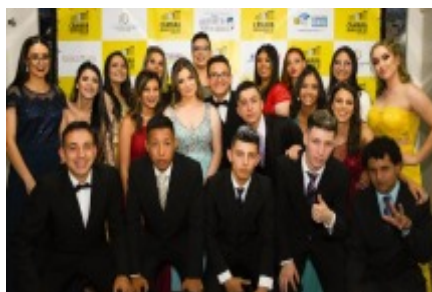
FORMANDOS TURMA DA MANHÃ 2019 CURSO DE INICIAÇÃO EM SERVIÇOS DE COMÉRCIO